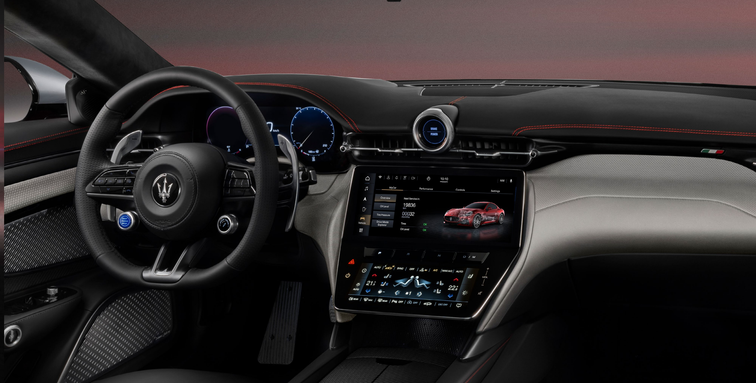
Trofeo - Grigio Lamiera