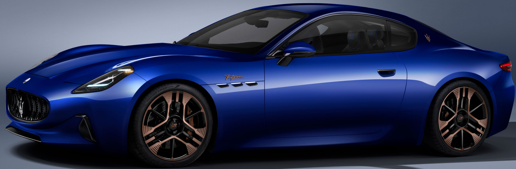
Folgore - Blu Inchiostro