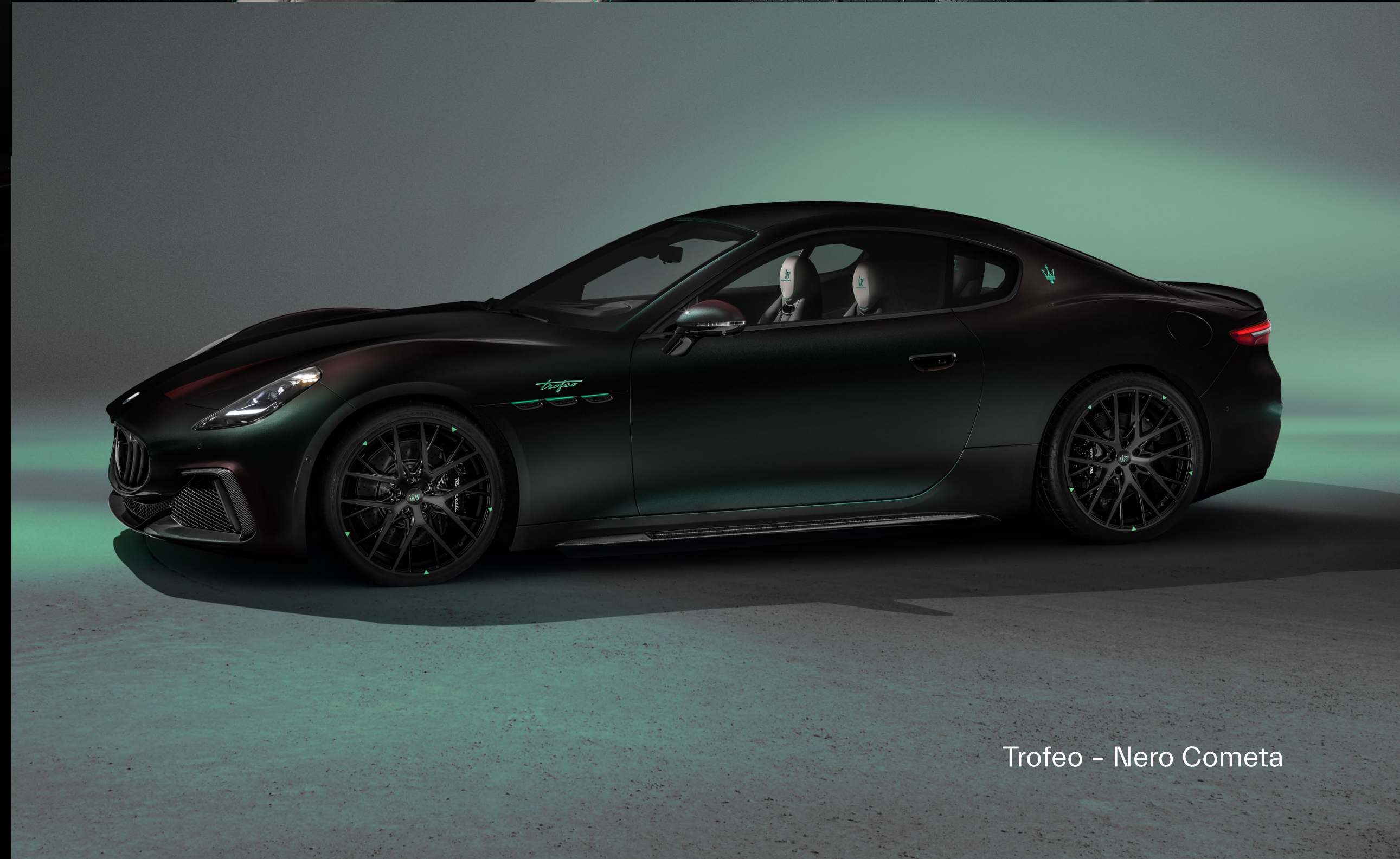
Trofeo - Nero Cometa