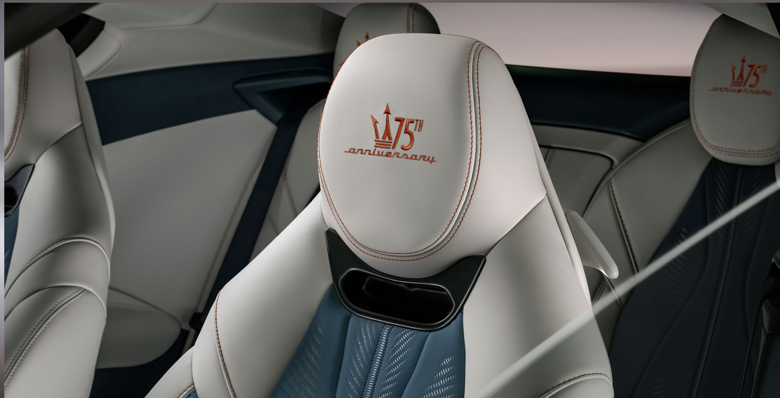
Folgore - Rame Folgore