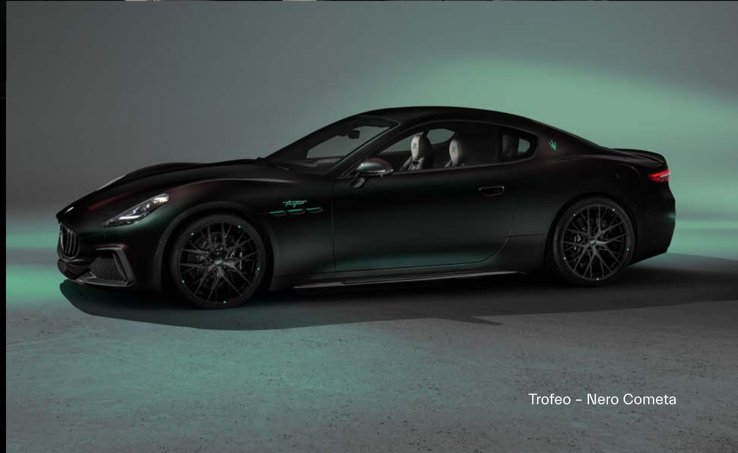
Trofeo - Nero Cometa