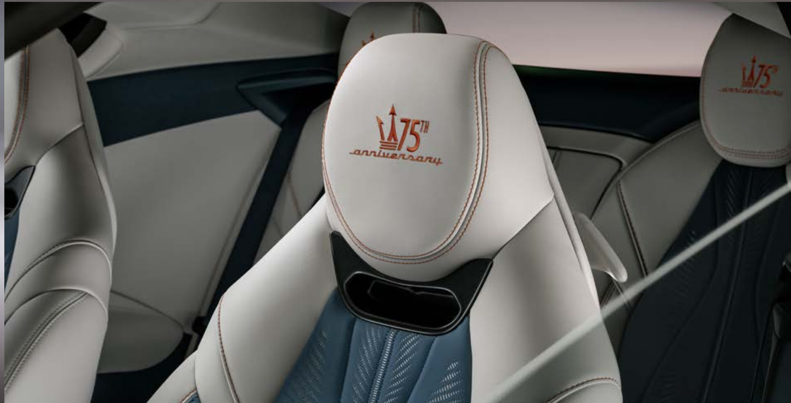
Folgore - Rame Folgore