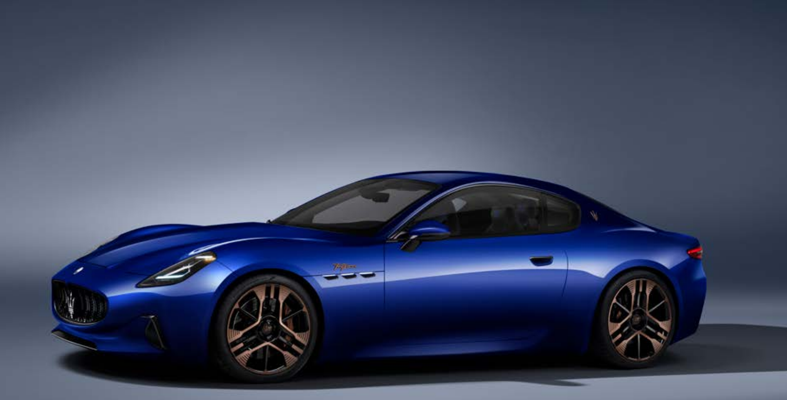
Folgore - Blu Inchiostro