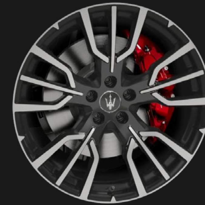
ETERE 20" MATTE GREY