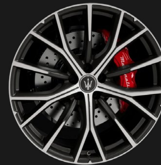
CRIO 21" MATTE ALUMINUM