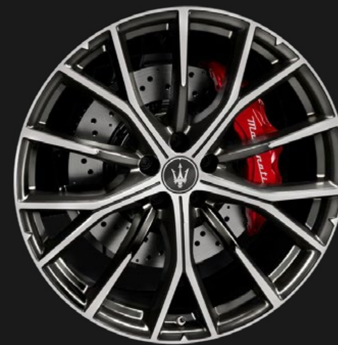
CRIO 21" GLOSSY MIRON