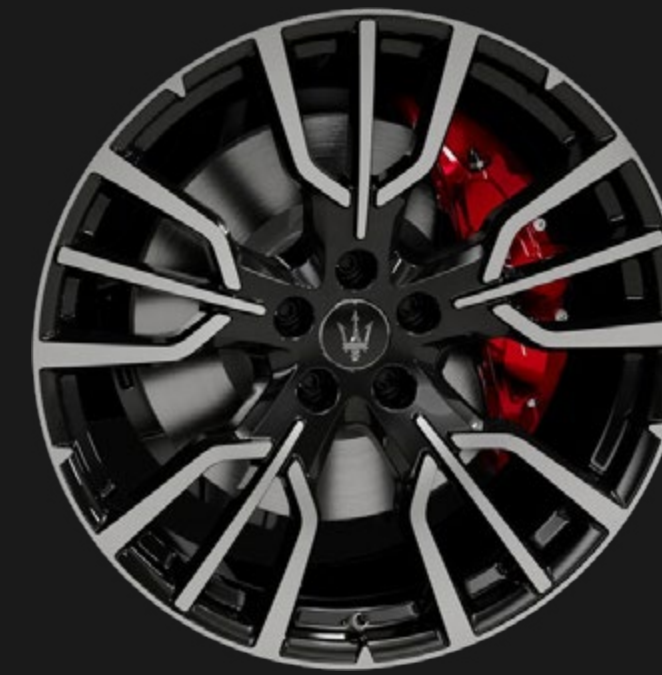
ETERE 20" GLOSSY BLACK