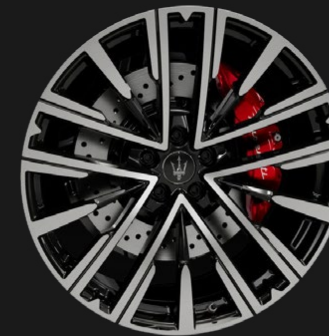
PEGASO 21" GLOSSY BLACK