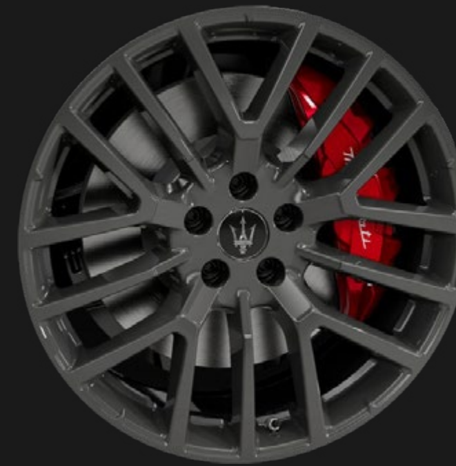
THETIS 19" GLOSSY BLACK

Chaque roue de la Ghibli est un pur chef-d'œuvre en soi : parfaitement équilibrée, concentrée en technologies de pointe et résolument stylée.