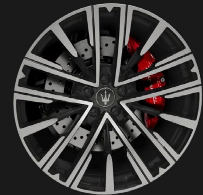
PEGASO 21" MATTE MIRON