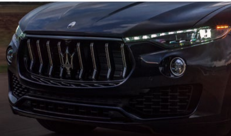
Levante GT - Kühlergrill