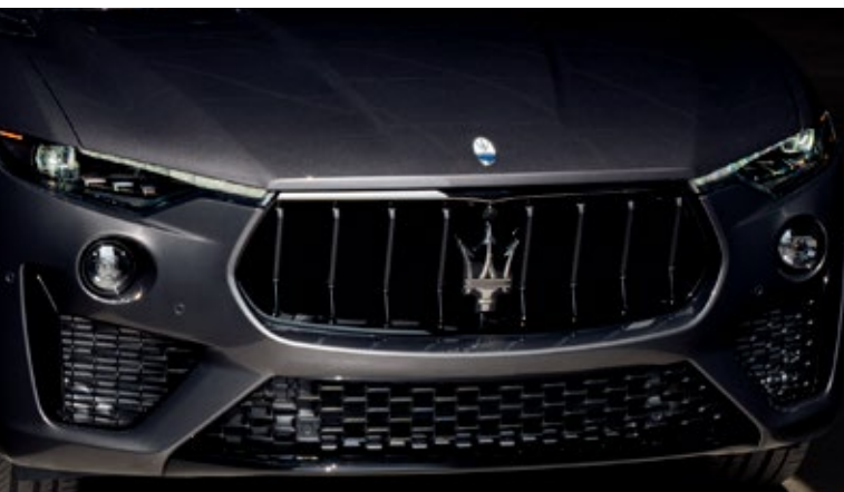
Levante - Kühlergrill