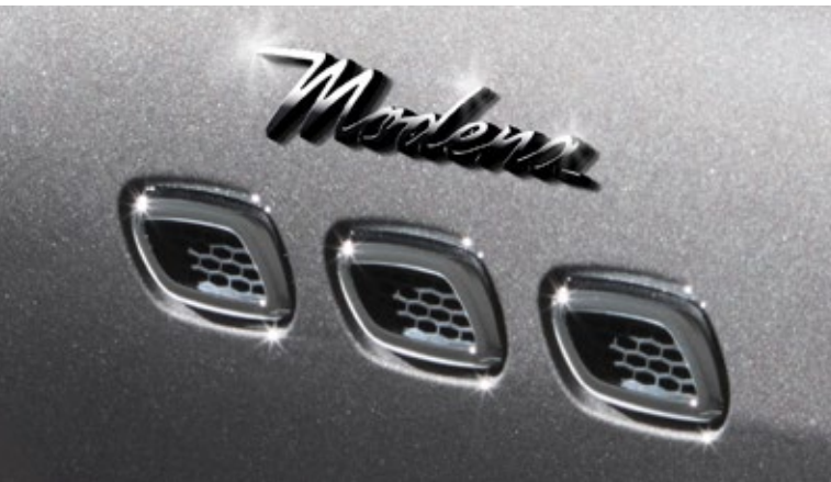
Levante - Seitliche Belüftungsschlitze und Modena-Emblem