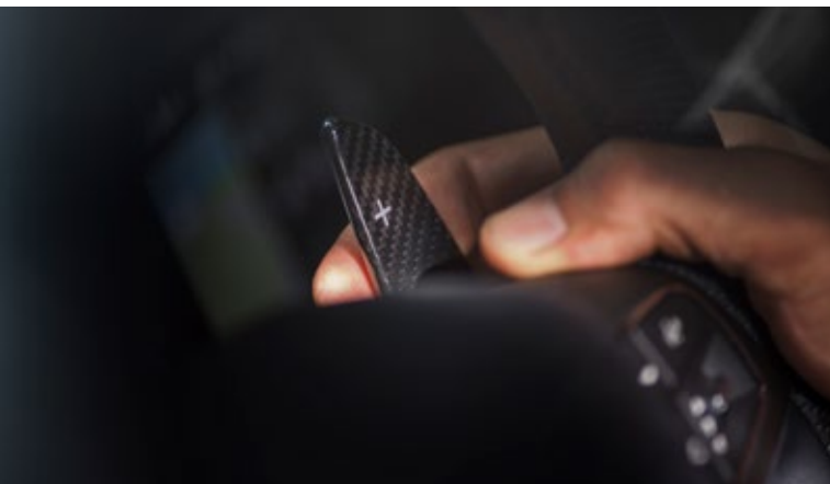
Levante - Schaltwippen