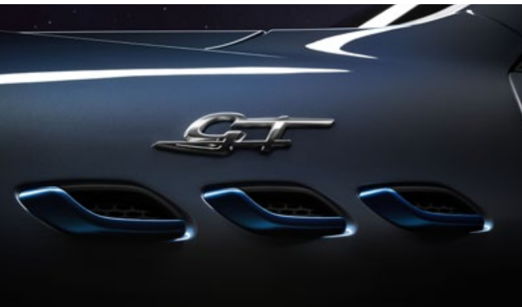
Levante GT - Seitliche Belüftungsschlitze und GT-Emblem

Levante GT Verbrauch (WLTP): kombiniert 10,6-9,7 l/100 km; CO 2 -Emissionen: kombiniert 238-221 g/km; CO 2 -Klasse: G