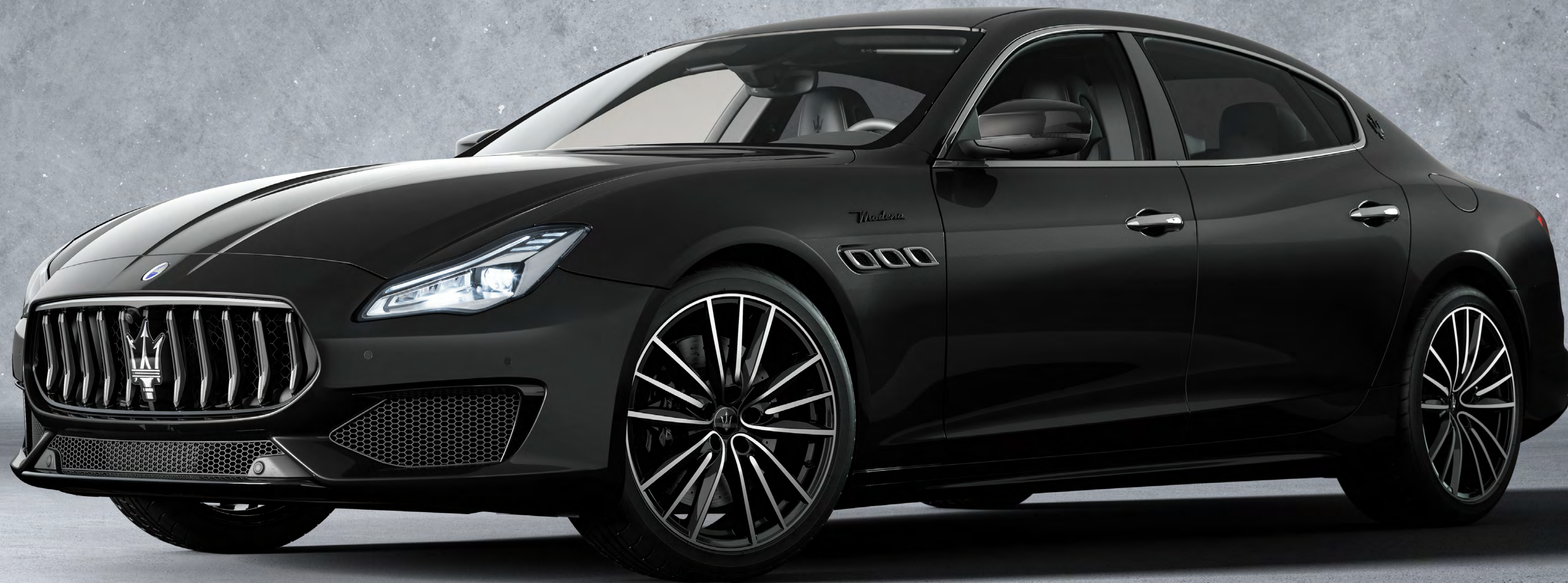
新Quattroporte Modena Q4